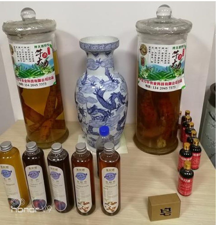
罗定市力丰农业科技有限公司除生产牛大力各种药外，还有牛大力茶、皂、酒等保健品

妇联、银行提供资金支持，科研部门技术服务到位，超市、药材市场负责收购牛大力产品，加工企业负责回收加工生产成品，使牛大力生产各环节畅通。