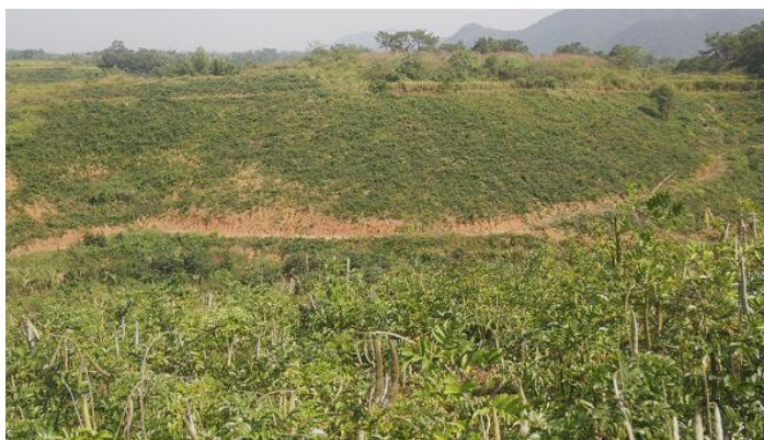
罗定市生江镇果子塘村牛大力种植基地

1、牛大力的作用。 中药名牛大力，又名大力薯，千斤拔，属药食两用植物。牛大力为保健养生的上乘中药材，有补虚润肺、强筋活络的功效，用于治疗腰肌劳损、风湿性关节炎、肺结核、慢性支气管炎、遗精、心脑血管等疾病。牛大力是制药企业加工壮腰健肾丸、强力追风透骨丸、活络止痛丸、舒筋健腰丸、桂龙药膏、强力健身胶囊、抗风湿液等中成药的主要成份药。牛大力鲜薯是熬制靓汤，泡保健酒的上品。