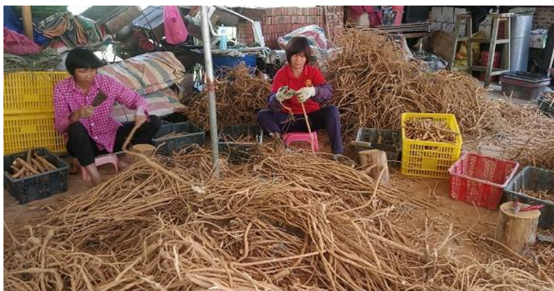
云浮市众发牛大力种植专业合作社社员在梳理、分类牛大力根茎、鲜薯。

培育凤山特色的健康养生品牌，即是打造长寿产品又是巩固脱贫成果的支撑产业。二是以合作社（公司）形式组织生产，统一品种，统一技术管理，统一加工销售，在生产过程中，合作社（公司）负责农户技术指导，组织产品销售。三是选好立地条件，牛大力是以地下块根为主的药材，必须在土层深厚，坡度在 30 度以下，不积水的地块种植，最好在交通便利的地方，方便种苗、肥料运输、机械开坑、机械采收，以减少大量人工成本；选好种苗，牛大力有小叶、中叶、大叶型三类，我县的野生牛大力一般是中叶型，所以应选择中叶型品种种植，以确保高产稳产，调动群众生产积极性。四是与国家知名的中医药技术研