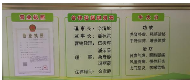
广东云浮市云城区南盛镇众发牛大力种植专业合作社100多农户入社，种植牛大力近万亩。

（四）实行规模开发。 采取能人+合作社+公司等形式发展牛大力产业，鼓励支持能人承包或租赁荒山荒地种植牛大力，而且有计划、规划大面积发展，以便于机械化操作。不搞小打小闹、撒胡椒粉的经营方式。