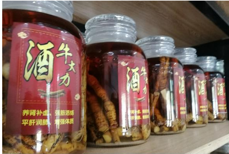
云浮市众发牛大力种植专业合作社生产牛大力酒

“茶皂”含有丰富的果胶酶、活性酵母、SOD(新型酶制剂)等, 对皮肤修复、皮炎等有很大的疗效, 还